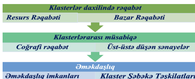
Şəkil 4. Klasterlər daxilində və arasında rəqabət

Mənbə: Porter M. The economic performance of regions, Regional Studies, 2003