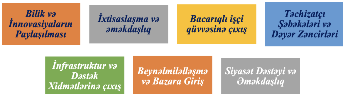
Şəkil 3. Sənaye klasterlərinin iqtisadi artıma nail olmaq və rəqabət qabiliyyətini artırmaq baxımından vacib olmasının əsas səbəbləri

Sənaye klasterləri iqtisadi artımın sürətləndirilməsində və rəqabət qabiliyyətinin artırılmasında mühüm rol oynayır. Bilik mübadiləsinə, ixtisaslaşmanı, əməkdaşlığı və ixtisaslı işçi qüvvəsinə, infrastruktura və bazarlara çıxışı asanlaşdırmaqla klasterlər innovasiya, məhsuldarlıq və bazar uğurunu təşviq edən dinamik mühit yaradır. Hökumətlər və bizneslər iqtisadi inkişafı stimullaşdırmaq və müasir qlobal iqtisadiyyatda rəqabət üstünlüyü saxlamaq üçün sənaye klasterlərindən istifadənin vacibliyini dərk edirlər [7, s.1788].